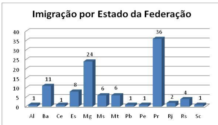
Gráfico 2 Migração por Estado de emigração

O Gráfico 1 dá uma ideia, apesar de a amostragem ser restrita à região do PAD Burareiro e Marechal, da naturalidade da emigração para o Estado de Rondônia. O gráfico 2 mostra o ponto de partida da emigração. De um modo ou de outro, confirma-se a origem sulista e sudestina da ocupação antrópica a partir dos anos 1970.